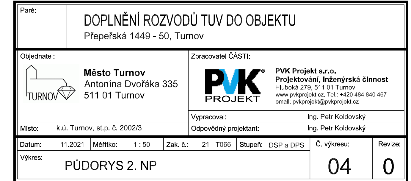
D.1.4.1 - ROZVOD TUV